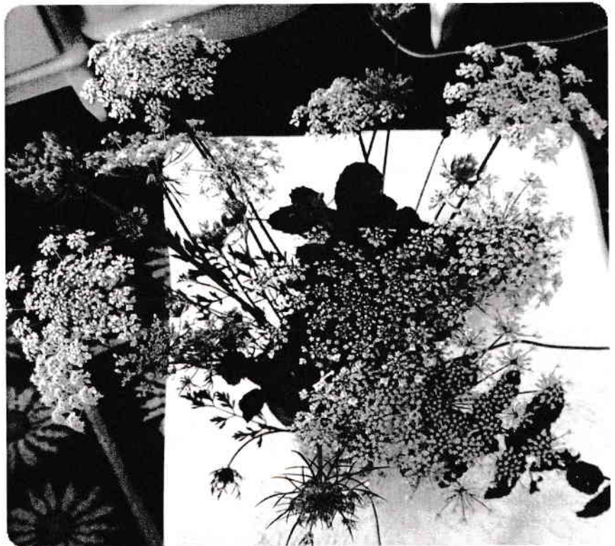
„Aleluia” ( Din Colecția „Ochiul”)

numai că adorând tăcerile care spun mai mult decât toate strigătele lumii încerc să tac.