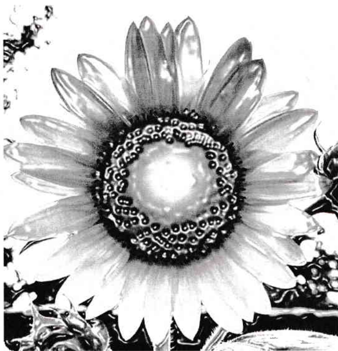
„De Soare și de Lună” (Din colecția „Ochiul”)

Peste-nceputuri trecut-au pești luminați iar peste sărbătorile noastre Sfântă Lumină întru ardere Luminătorule.